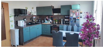
Wohnzimmer m. Küche