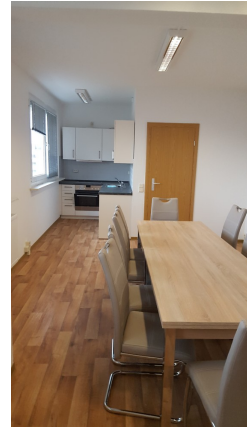
Gemeinschaftsraum mit Küche